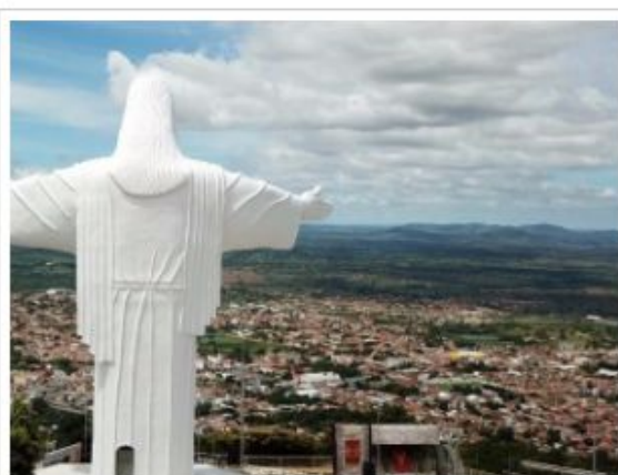
Palmeira dos Índios tem a melhor governança municipal de Alagoas

Município teve melhor resultado do estado no grupo e fez maior pontuação que Maceió e Arapiraca